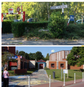
Espace MACC'S 9, Avenue Paul Langevin 59650 Villeneuve d'Ascq