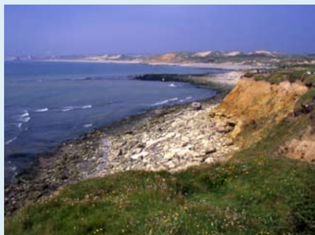
La pointe aux oies à Wimereux

L'activité camping - car est une préoccupation pour les communes du littoral confrontées parfois à une concentration de ces véhicules dans des zones ou des sites non organisés pour les recevoir. La solution est de mettre en place un réseau d'aires de services aménagées pour permettre de vidanger les cuves dans des conditions respectueuses de l'environnement.