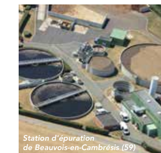
Station d'épuration de Beauvois-en-Cambrésis (59)