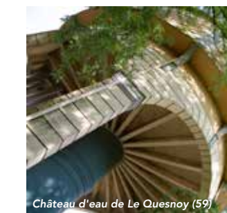
Château d'eau de Le Quesnoy (59)