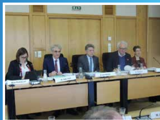
Séance du Conseil d'Administration du 15 mars 2019