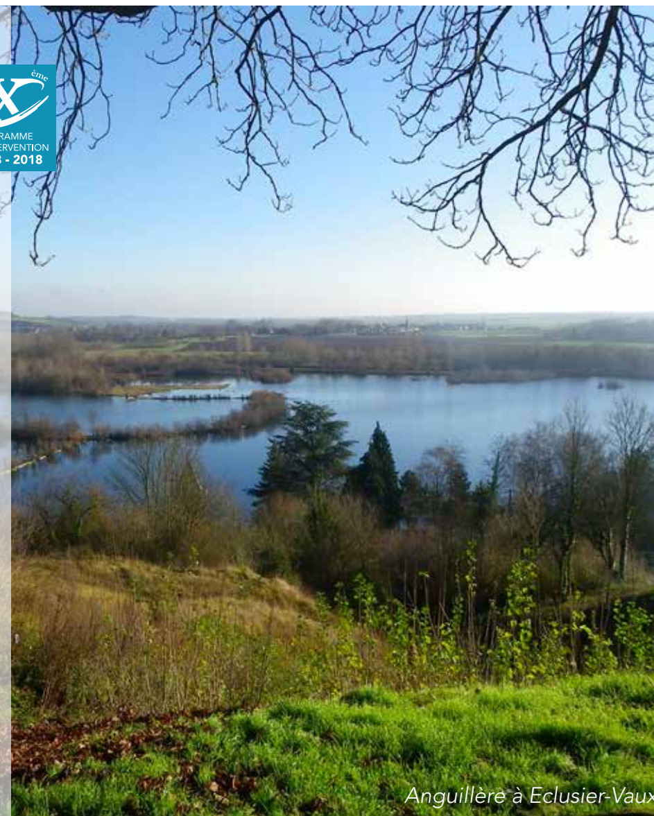
Anguillère à Eclusier-Vaux