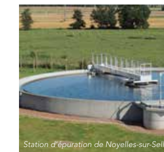
Station d'épuration de Noyelles-sur-Selle