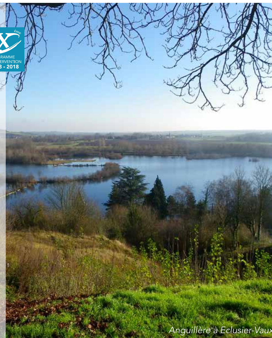
Anguillère à Eclusier-Vaux