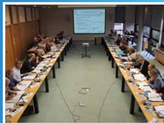
Séance du Conseil d'Administration du 14 octobre 2016