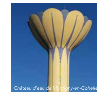
Château d'eau de Montigny-en-Gohelle