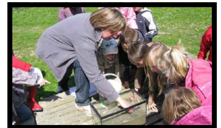
Animation scolaire réalisée dans le cadre du SAGE de l'Yser