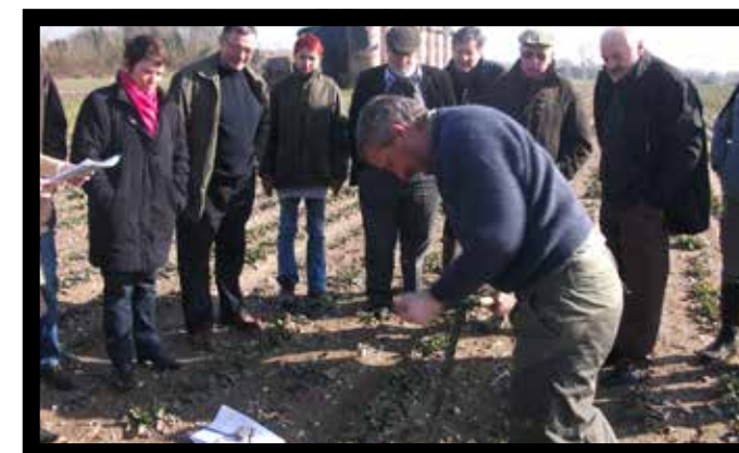
Une réunion sur le terrain du comité de pilotage « zones humides » du SAGE de l'Authie