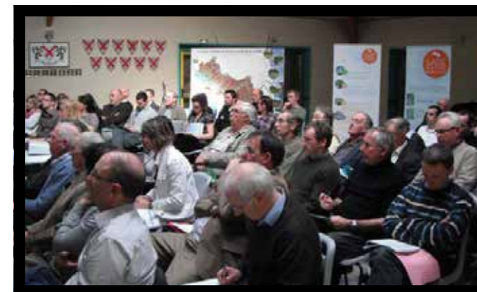
Colloque SAGE et urbanisme pour les élus du SAGE Canche