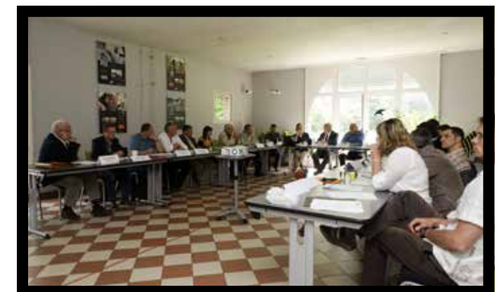
Une commission locale de l'eau du SAGE Scarpe-Aval