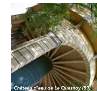
Château d'eau de Le Quesnoy (59)