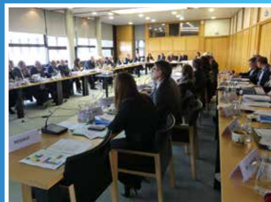
Séance du Conseil d'Administration du 22 novembre 2019