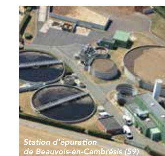
Station d'épuration de Beauvois-en-Cambrésis (59)