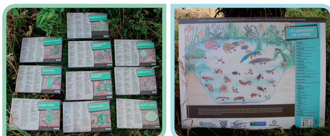
Les panneaux réalisés grâce aux dessins des enfants des écoles Bellevue et Blanc Misseron de Crespin