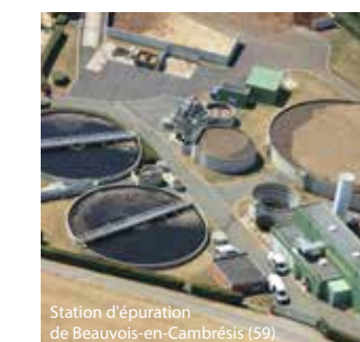
Station d'épuration de Beauvois-en-Cambresis (59)