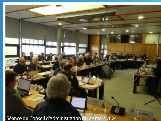
Séance du Conseil d'Administration du 29 mars 2024