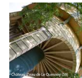
Château d'eau de Le Quesnoy (59)