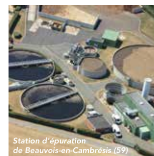
Station d'épuration de Beauvois-en-Cambrésis (59)