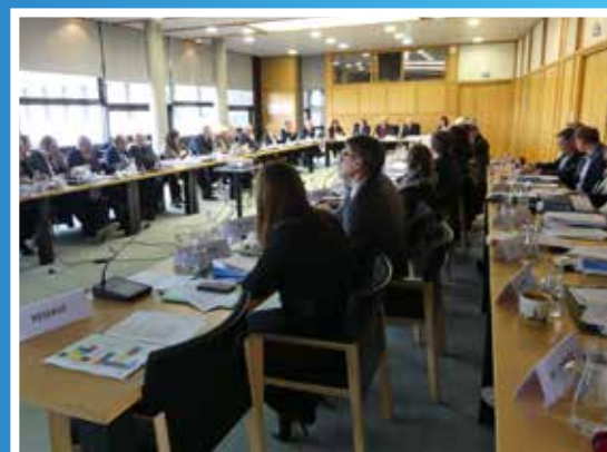
Séance du Conseil d'Administration du 22 novembre 2019