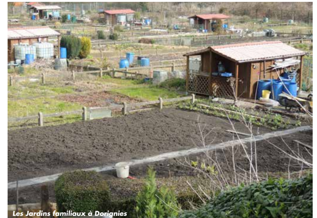
Les Jardins familiaux à Dorignies

Depuis 2009, l'agence de l'eau a engagé plus d'1.5 M€ pour accompagner les actions de réduction de l'utilisation des pesticides utilisés en zones non agricoles.