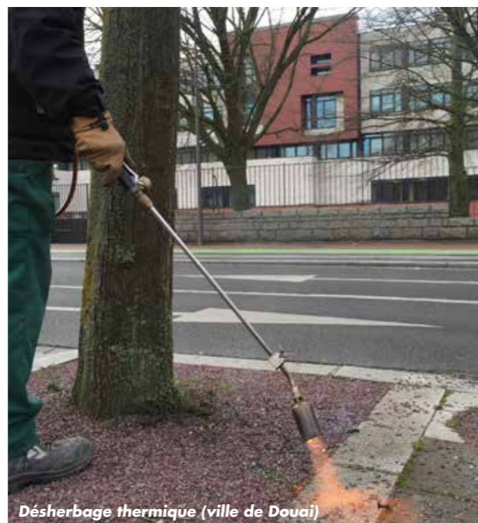
Désherbage thermique (ville de Douai)

Interdiction totale de la commercialisation et la détention de produits phytosanitaires à usage non professionnel.